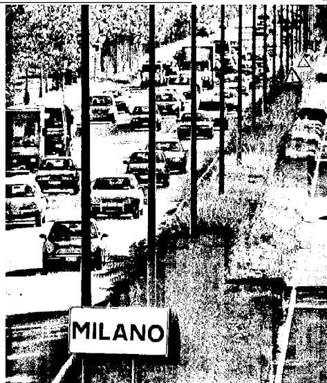
CAOS STRADALE Ticket antismog, l'assessore Croci: «Pagherà chi inquina l'aria»

NUOVE STRATEGIE ANTI INQUINAMENTO Secondo l'assessore Croci i blocchi contro lo smog non basterebbero. Servono altri strumenti, spiega, come il ticket e controlli anti smog per fare pagare chi inquina l'aria milanese