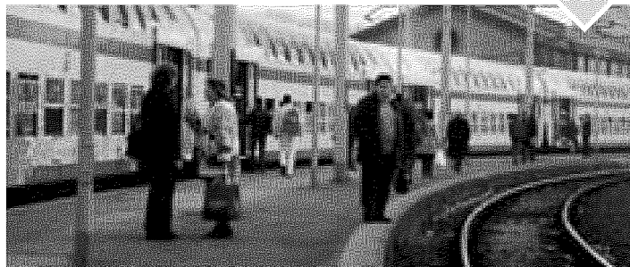
3 Ferrovia Milano-Mortara