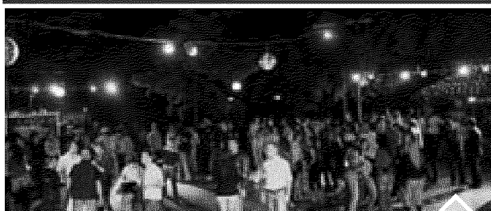
1 Discoteca all'aperto Idroscalo