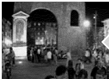
2 Colonne di San Lorenzo